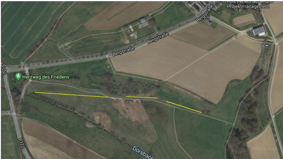
Entwässerungsgraben gelb markiert

Einer der Hauptabwassergräben für das Oberflächenwasser bedarf einer Reinigung. Auf Grund der Gegebenheiten ist ein Ausfräsen von diesem Graben nicht möglich. Der Gemeinderat sichtet das vorliegende Angebot zu der Maßnahme.